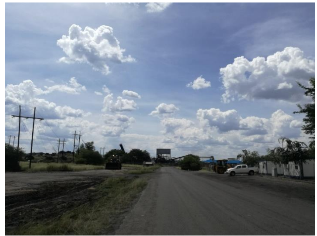
発電所に隣接している炭鉱