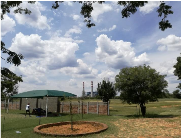
大気汚染モニタリングステーションのある小学校